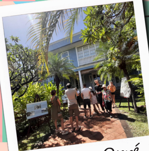
Maison Orré 9h-12h et 14h-17h

Fresque à colorier (feutres fournis sur place), jeu des 7 familles, jeu de l'oie géant au sol.