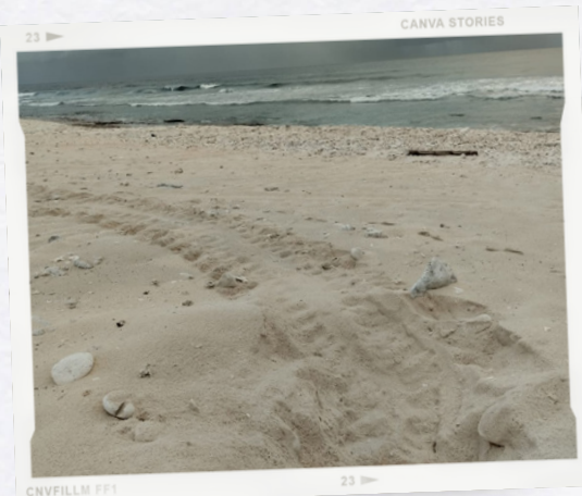
Traces d'une tortue verte - N. Gravier

Nos missions à Tromelin sont : le Suivi de la population de tortues, d'oiseaux et le contrôle de la végétation.