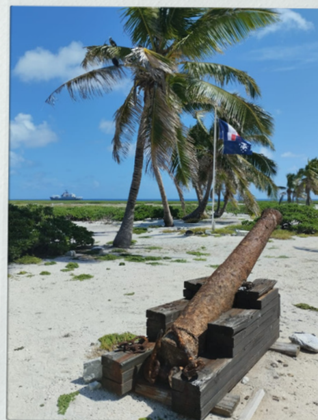
Canon de l'Utile Nelly Gravier