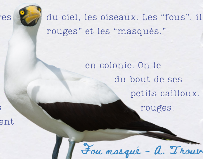
Fou masqué - A. Trouvilliez

en colonie. On le reconnaît à la couleur noire de sa queue et du bout de ses ailes. Il fait son nid sur le sol avec des petits cailloux. Il plonge de 30 mètres comme le fou à pieds rouges. Il pose ses œufs sur les pattes qui permettent de les maintenir au chaud.