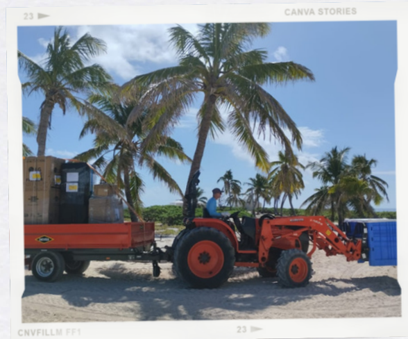
Livraison de vivres - N. Gravier

Depuis les années 1950, une station a été bâtie pour accueillir les scientifiques. C'est la seule des îles Éparses où résident des scientifiques.