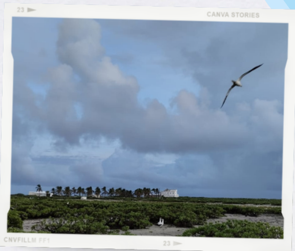
Ile Tromelin - N. Gravier

Nous faisons escale sur l'Ile Tromelin pour apporter des vivres aux scientifiques et agents qui résident sur place pour des périodes de 4 mois.