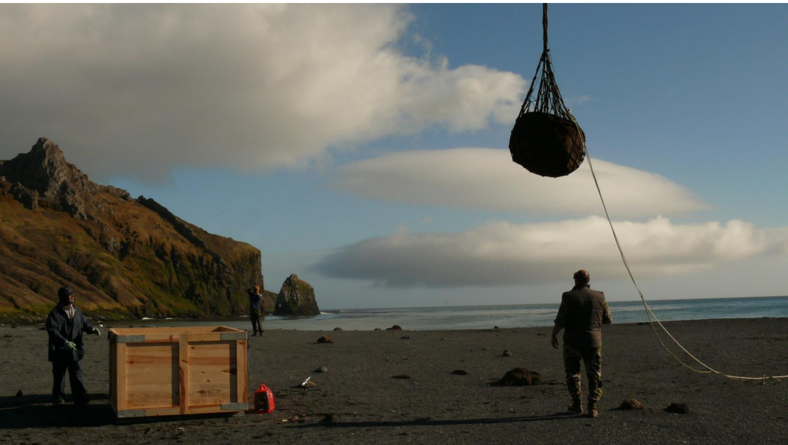
Opération « Obélix » de sauvetage archéologique du fondoir à graisse de la vallée des Phoquiers, 2006