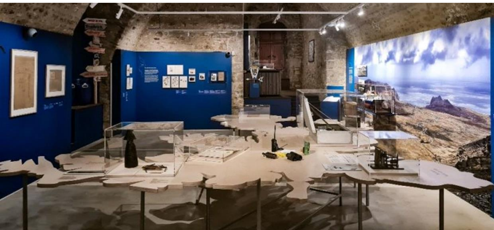
Exposition Voyage en terres australes Crozet & Kerguelen 1772-2022 au musée national de la Marine à Brest, 2022