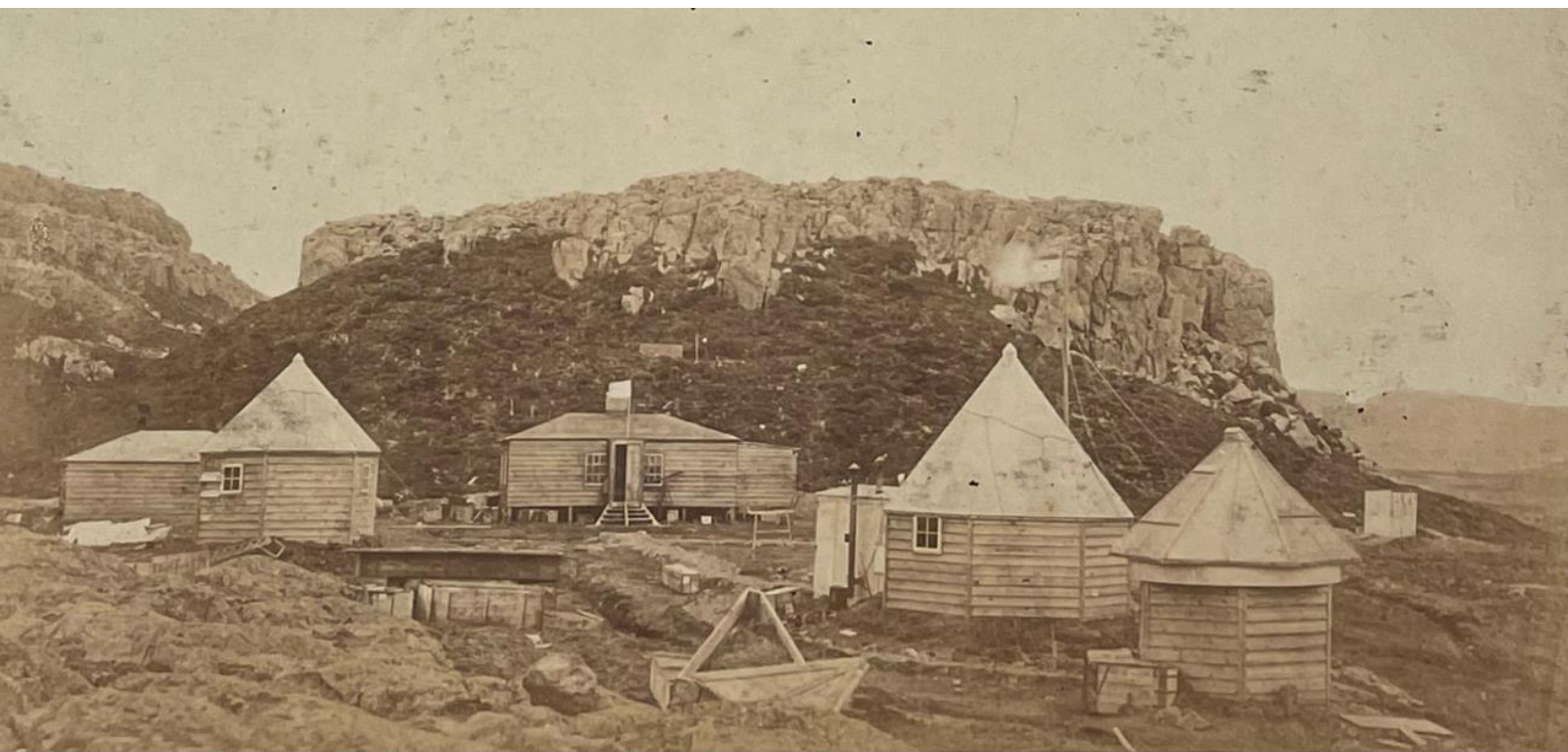
Station astronomique britannique installée en baie de l'Observatoire, 1874