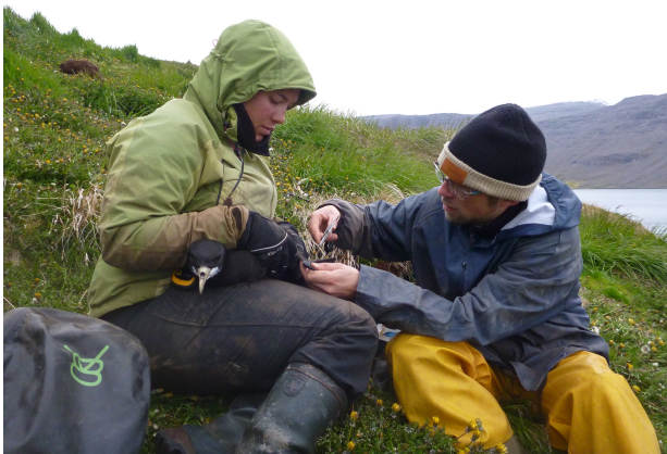
Suivi des oiseaux marins (Bagueage pétrel à menton blanc) – Kerguelen

Partez à la découverte des différents métiers de la base du district d'Amsterdam et découvrez certains métiers particuliers des Terres australes françaises.