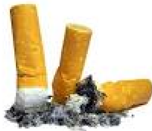
1 – 3 ans