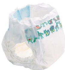
400 – 450